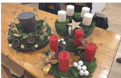
Adventskranz basteln 2021

Als Einstimmung in den Advent laden wir Eltern und/oder Grosseltern mit ihren Kindern/Grosskindern ein, am Freitag, 25. November, 14 bis 18 Uhr, in der Unterkirche , selber Adventskränze zu basteln. Die vier Kerzen und Dekomaterial bringen alle selber mit. Tannäste, Ringe und Stifte für die Kerzen werden zur Verfügung gestellt. Es wird ein Unkostenbeitrag von Fr. 10 erhoben.